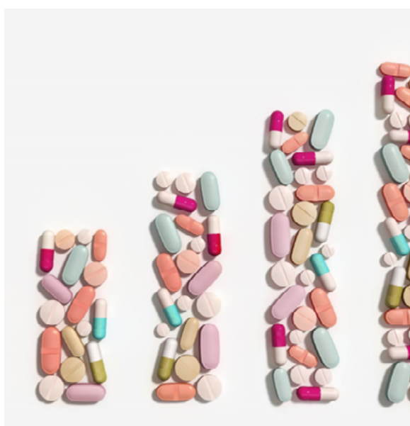
Figura 1: Dilema de Heinz.