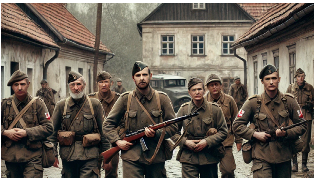
Figura 10: imagen construida con inteligencia artificial.

pitán a cargo, sabiendo que la tarea no era moralmente correcta y que no había razones para llevarla a cabo, debía cumplirla. Les dice a sus soldados: “El que no quiera acatar esta orden, se puede retirar, porque sabemos que es moralmente incorrecta”.