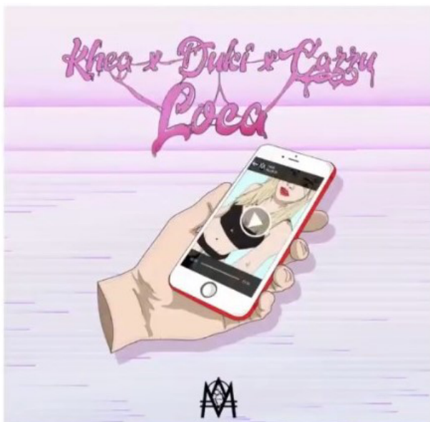
Figura 4: arte de tapa “Loca”.

Siguiendo con esta línea, traemos el ejemplo del arte de tapa del single Loca , que es compartido por Kea, por Duki y por Cazzu. Son tres artistas fundamentales de la escena, en la cual, en la canción que se llama Loca , el motivo del videoclip es la sensualidad.