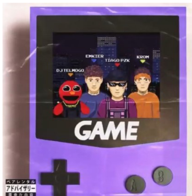
Figura 1: Arte de tapa.

Vemos que ya no es el uso del auto-tune, una herramienta que simplemente oculta errores; sino que es un recurso estético para la producción artística. Entonces, en el video apreciamos cómo el cantante carraspea y elige decirle al productor “Subime el auto-tune”, y a partir de ahí continúa la canción.