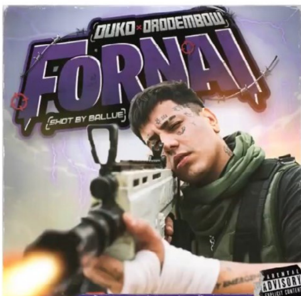
Figura 3: arte de tapa Fornai.

Seguimos con esta otra categoría: “uso de herramientas Multimedia”. En este arte de tapa el gaming y los videojuegos se cruzan con la música. Otra vez vemos alguien emulando a la tapa de un CD y una calcomanía del control parental, con la sutileza de que parece rota o gastada.