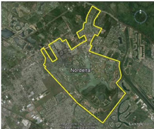
La ciudad de Nordelta se encuentra ubicada a 30km al Norte de la Ciudad de Buenos Aires

(Re) Pensar en la gestión de residuos reciclables en la Provincia de Buenos Aires