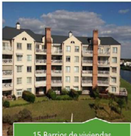
15 Barrios de viviendas multifamiliares (condominios, townhouses, edificios)

de espacios verdes de la ciudad y la propiedad de cada vecino que lo hace por su cuenta, y los inertes, que son restos de obra, mampostería, rezagos de alguna que otra reparación, etcétera.