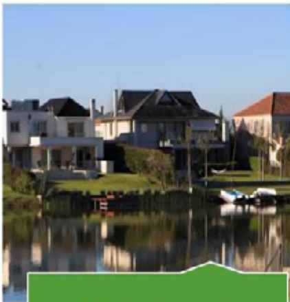
14 Barrios de viviendas unifamiliares

(Re) Pensar en la gestión de residuos reciclables en la Provincia de Buenos Aires