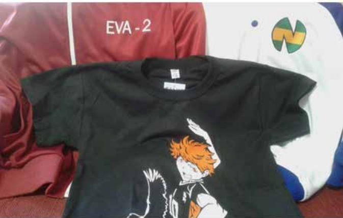
Fig. 6. Ropa no oficial de Evangelion, Hinata de Haikyuu y Captain Tsubasa.