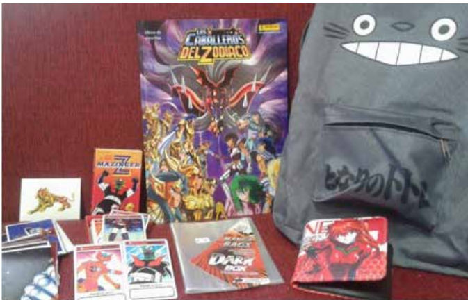
Fig. 5. Álbum y figuritas de Los Caballeros del Zodíaco de Panini Argentina, Cartas de Mazinger Z de Cromi, billetera de Evangelion, mochila de Totoro, bolsas para proteger los manga.