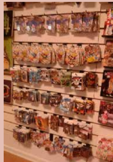
Fig. 8. Collares entre otros productos en Gastovic. anime store.