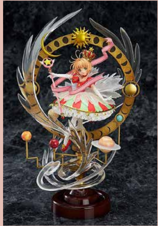
Fig. 7 Figura original de Sakura. Valor $20.900.